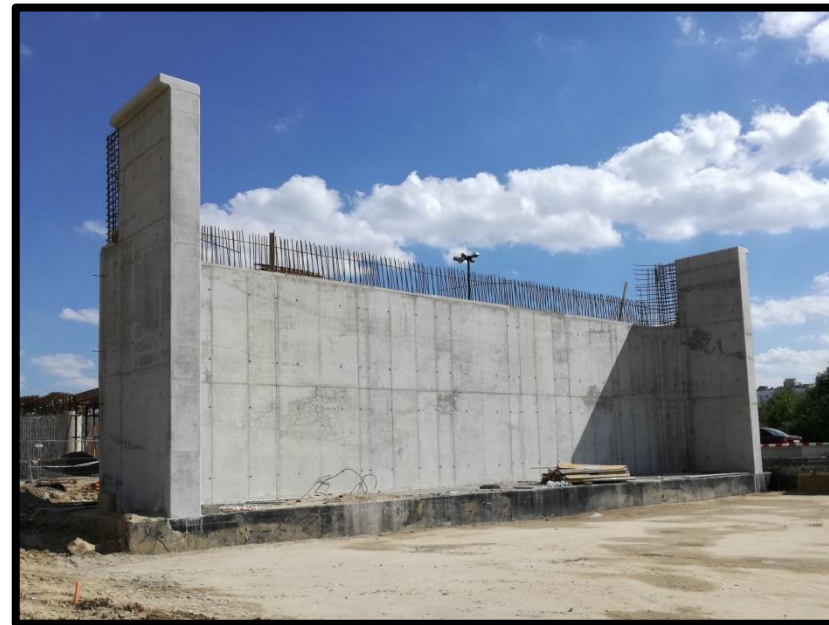
Fot.4. Przyciótek wiaduktu – strona wschodnia