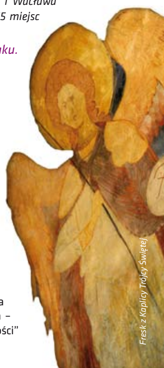
Fresk z Kaplicy Trójcy Świętej

w estońskim Tallinie oraz dwa miejsca w Holandii: Pałacowi Pokoju w Hadze, w którym mieści się siedziba Międzynarodowego Trybunału Sprawiedliwości oraz nazistowski obozowie przejściowe w drugiej wojny światowej Westerbork, znajdującemu się w Hooghalen na północnym wschodzie kraju. W naborze 2014 r. państwa uprawnione do składania propozycji, przekazały do Komisji Europejskiej ogółem 36 kandydatur. Europejski panel ekspertów zarekomendował przyznanie Znak 16 kandydatom, przy czym Polska jest jedynym krajem UE, który uzyskał aż trzy nominacje (Konstytucja 3 Maja 1791, Historyczna Stocznia Gdańska - obiekty związane z powstaniem „Solidarności” oraz Unia Lubelska).