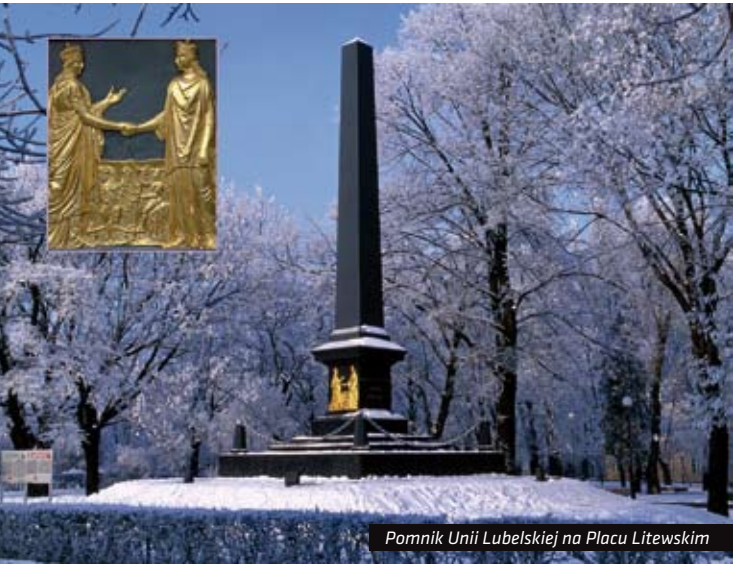
Pomnik Unii Lubelskiej na Placu Litewskim