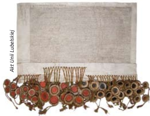
Akt Unii Lubelskiej

Celem Znak Dziedzictwa Europejskiego nie jest ochrona obiektów lecz promowanie ich europejskiego wymiaru, udostępnianie ich jak najszerszemu gronu odbiorców, w szczególności młodym ludziom, a także o zapewnienie wysokiej jakości informacji oraz organizację działań edukacyjnych i kulturalnych, podkreślających rolę i miejsce danego obiektu w historii Europy i integracji europejskiej. Znak Dziedzictwa Europejskiego może ponadto przynieść korzyści gospodarcze, wspomagając rozwój turystyki kulturalnej.