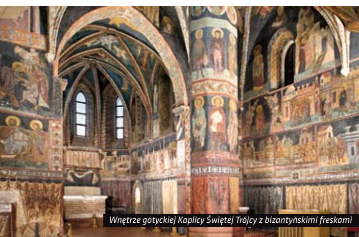
Wnętrze gotyckiej Kaplicy Świętej Trójcy z bizantyjskimi freskami