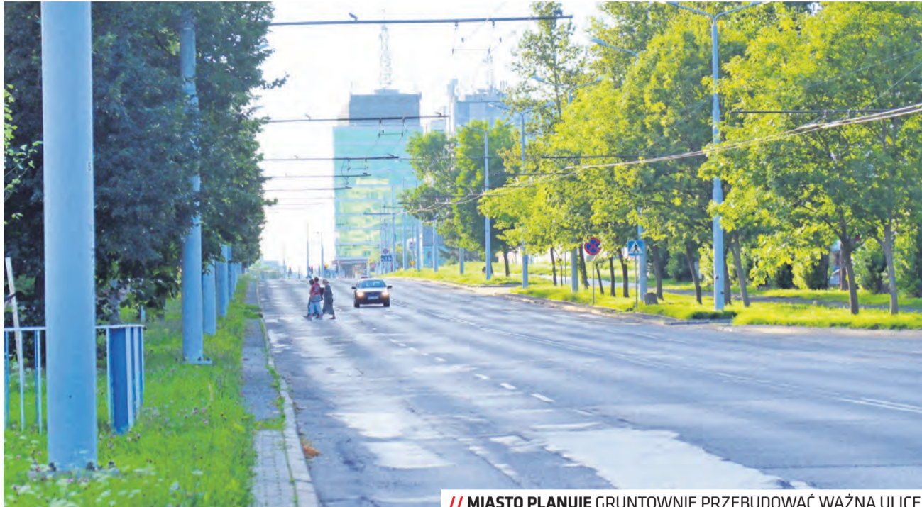
// MIASTO PLANUJE GRUNTOWNIE PRZEBUDOWAĆ WAŻNĄ ULICĘ