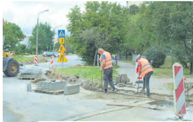
// UKŁADANIE KRAWĘŻNIKÓW NA UL. JAGIEŁY

Nowe nawierzchnie zostały położone m.in. na ulicach: Goździkowej, Biskupińskiej, Słupian, Krwawicza i Piątkowskiego. Zakończyły się też prace na ul. Niepodległości, gdzie drogowcy naprawili asfaltową nawierzchnię zatok parkingowych i przystankowych komu-