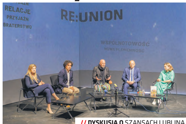
// DYSKUSJA O SZANSACH LUBLINA

– Lublin realizując program Europejskiej Stolicy Młodzieży, pokazuje, że jest miastem otwartym, przyjaznym oraz odpowiadającym na wyzwania zmieniających się czasów. Zależało nam na aktywnym udziale mieszkańców i miesz-