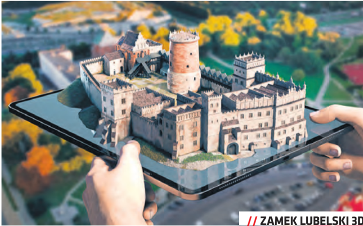
// ZAMEK LUBELSKI 3D

Nowy model 3D przedstawia rezydencję królewską, jeden z najważniejszych zabytków w historii Lublina. Początki zabudowań na Wzgórzu Zamkowym sięgają jeszcze XII wieku, ale murowany zamek powstał wraz z Kaplicą Trójcy Świętej w wieku XIV. Budynek gościł polskich królów, w tym wielokrotnie króla Władysława Jagiełłę, a w 1569 roku w jego salach toczyły się