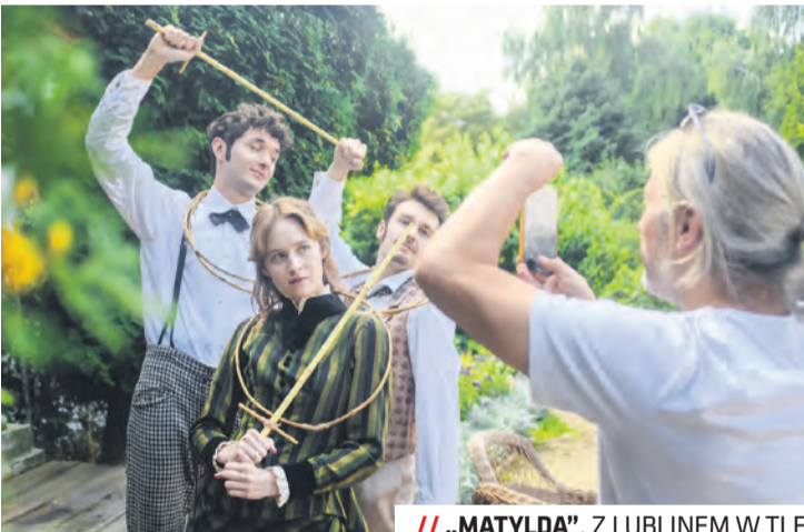
// „MATYLDA”, Z LUBLINEM W TLE

„Matyllda” to saga o walce dobra ze złem. W tle rozgrywają się historyczne wydarzenia i zjawiska, takie jak nie-