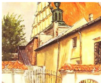
LUBLIN W MALARSTWIE - ARTUR ORŁOWSKI