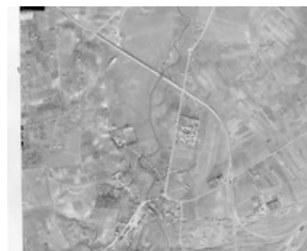
LOTNICZE ZDJĘCIA LUBLINA Z 1944 R.