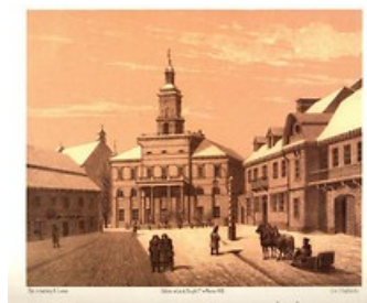
LUBLIN W ILUSTRACJACH A. LERUE'GO